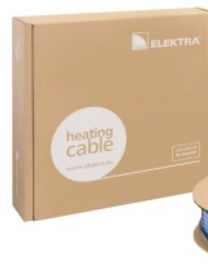
Przewód grzejny ELEKTRA VCD

Elektryczne akumulacyjne ogrzewanie podłogowe ELEKTRA zapewnia minimalizację kosztów inwestycyjnych oraz eksploatacyjnych ogrzewanych pomieszczeń. Jest to system całkowicie bezobsługowy, w pełni autonomiczny, pozwalający na indywidualne kształtowanie temperatury w każdym pomieszczeniu z osobna.