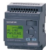
Regulator temperatury Fuzzy Logic

SIĘĆ DYSTRYBUTORÓW I INSTALATORÓW NA TERENIE CAŁEGO KRAJU!