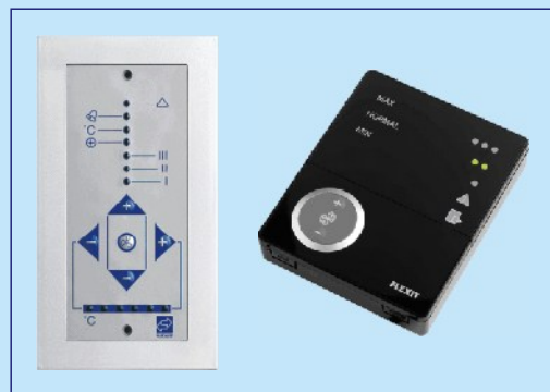
PANELE STERUJĄCE CI50 I CI60

Zastosowana w produktach FLEXIT® wyjątkowo dobra izolacja z wełny mineralnej w każdej ścianie sprawia, że odzyskane ciepło nie jest tracone przez ścianki boczne i jest w pełni przekazywane do pomieszczeń.